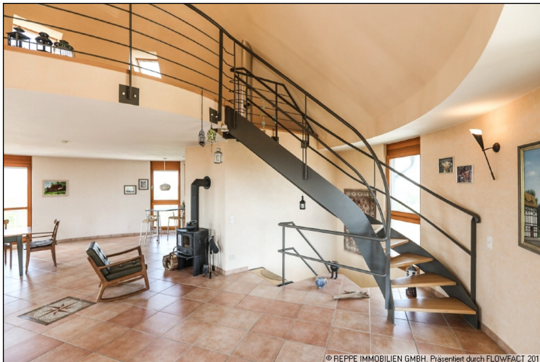
Wohnzimmer Hauptwohnung mit Aufgang zur Galerie