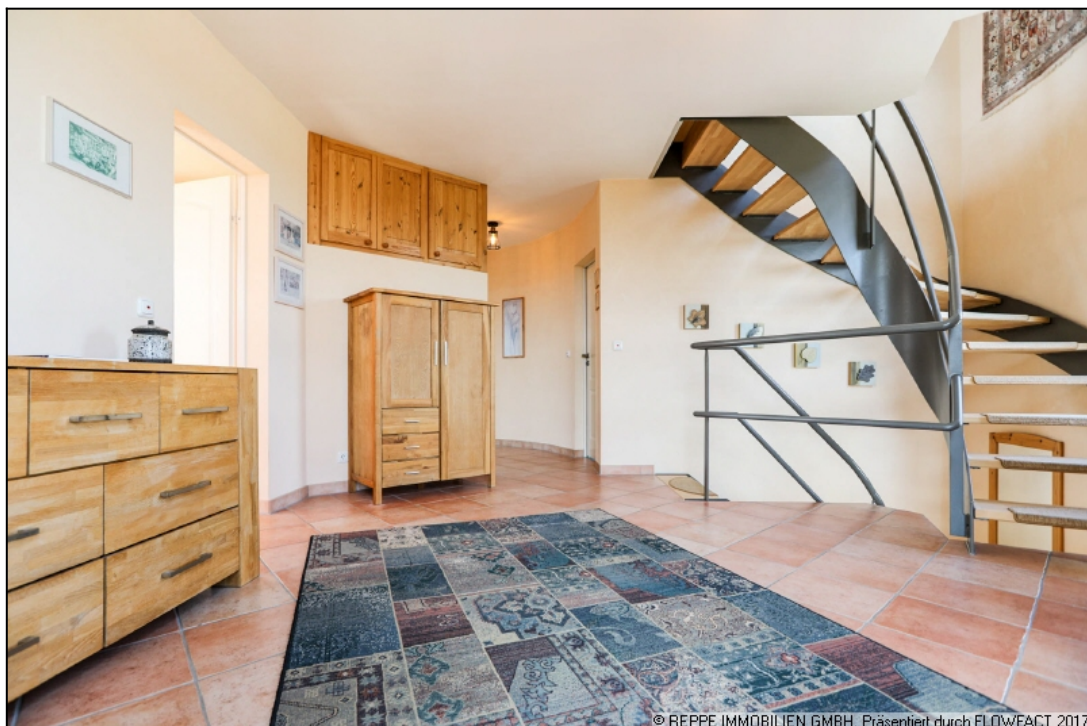
Flur Diele Hauptwohnung